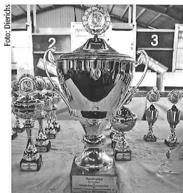
Oben: Deining ist eine Gemeinde im Landkreis Neumarkt in der Oberpfalz. Unten: Diesen Wanderpokal bekommt der jeweils amtierende Deutsche Meister.